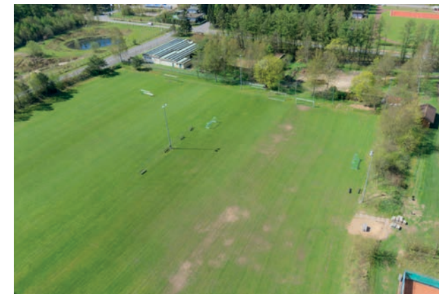
Sportplatz des Sportzentrums des TVT Segeberger Straße 1, 24610 Trappenkamp