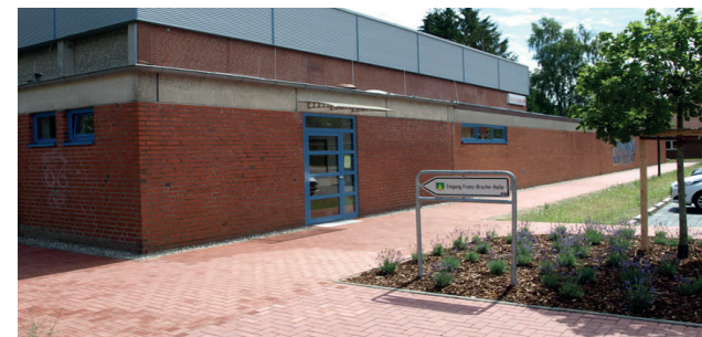
Franz-Buche-Sporthalle Königsberger Straße, 24610 Trappenkamp