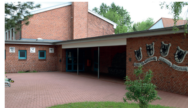
Turnhalle Grundschule Trappenkamp Gablonzer Straße 42, 24610 Trappenkamp