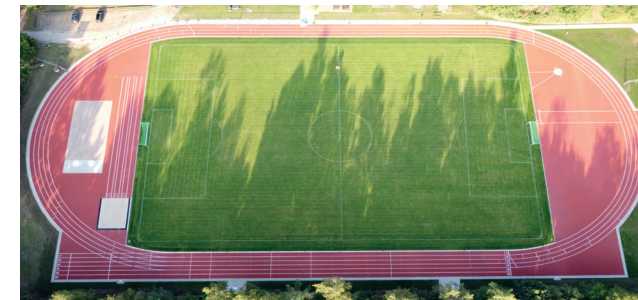
Sportplatz des Sportzentrums des TVT Segeberger Straße 1, 24610 Trappenkamp